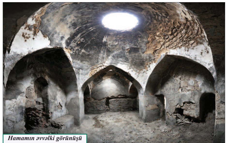
Hamamın əvvəlki görünüşü

Bəli, muxtar respublika ərazisində mövcud olan qədim hamamlar uzaq keçmişdən onların xalqımızın sosial həyatının bir elementi olduğunu göstərir. Bu abidələrin qorunub saxlanması, yaşadılması isə tarixi və mədəni irsimizin öyrədilməsi, təbliği baxımından böyük əhəmiyyət daşıyır. Ümid edirik ki, Naxçıvanda digər çoxsaylı nadir memarlıq nümunələri, xüsusilə də buxana binaları kimi, qədim Şərq hamamları da qədim diyarımızın tarixi və zəngin mədəniyyəti ilə maraqlanan həm yerli, həm də əcnəbi tədqiqatçıların maraq obyektinə çevriləcək.