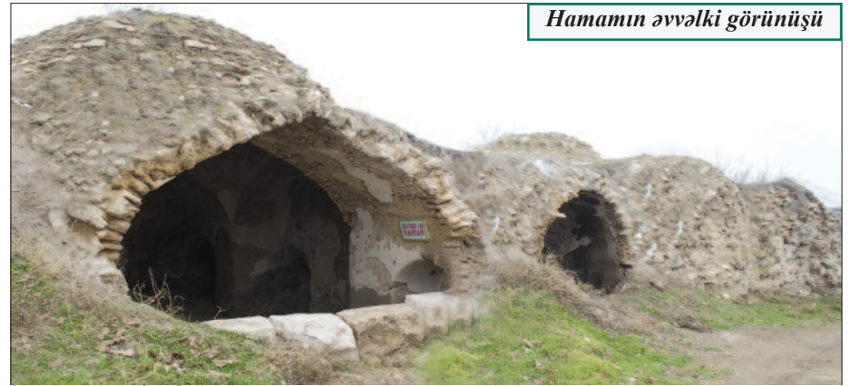
Hamamın əvvəlki görünüşü

laşdırılıb, bu abidələrin bərpası və yenidən qurulması diqqətdə saxlanılıb. Şahtaxtı kəndindəki Şərq hamamında da bərpa işləri yüksək səviyyədə aparılaraq ona ikinci həyat verilib. Bərpa işləri zamanı hamam binası xaricdən travertin daşlarla, daxili divarları, tağ və günbəzlər qədimnövü kərpiclə, binanın dam örtüyü və günbəzlərin üst qatı isə alüminium vərəqlərlə üzlənib. Burada qadın gözəllik salonu, dərzisi, rəssam və fotoqraf üçün otaqlar ayrılıb. Bu xidmət sahələrində 4 nəfər işlə təmin olunub. Tarixi hamam binasında xidmət sahələrinin yaradılması bir tərəfdən bu abidənin qorunub sax-